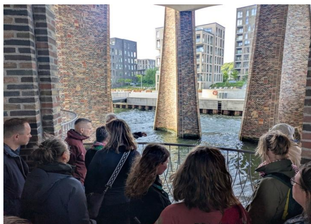
Rundvisning i Fjordenhus.