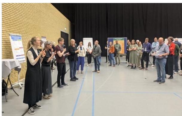
Postersessionen onsdag. Der blev tolket til både dansk tegnsprog og nordiske tegn undervejs.

Traditionen tro var konferencen forsynet med et godt socialt program, og deltagerne kunne på forhånd tilmelde sig en af følgende tre onsdagsarrangementer som fandt sted efter det faglige program: I fodsporene på en viking som var en udflugt til Jelling, en byvandring med særligt fokus på Vejle i middelalderen og en omvisning i Fjordenhus. Jeg valgte sidstnævnte og kan derfor pynte denne afrapportering med nogle billeder fra Olafur Eliassons imponerende bygningsværk (Kirk-Johansen-familien havde givet Eliasson frie hænder til at udfolde sig kunstnerisk og arkitektonisk, og det var en god idé). Det