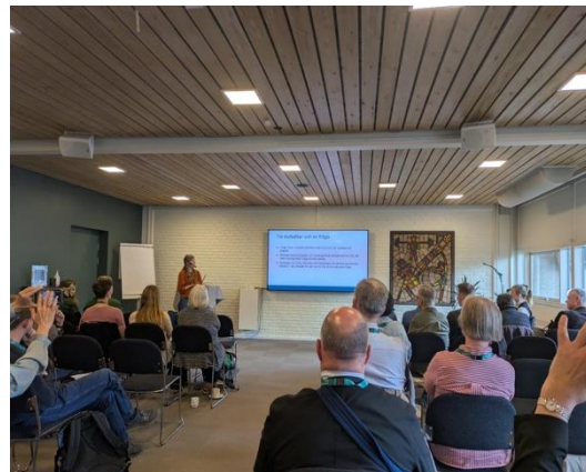
Præsentation på spor C (Frekvensen).