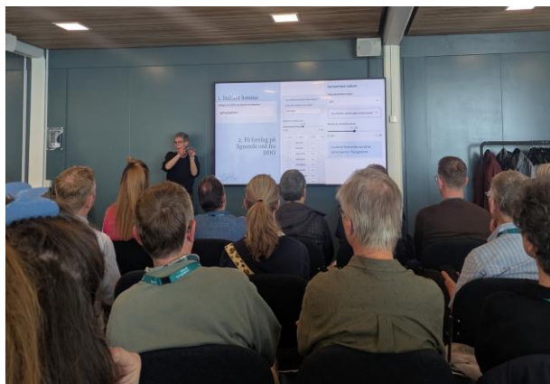
Præsentation på spor B (Bølgelængden).

Onsdag formiddag bød på tre spændende temablokke om historiske ordbøger i arnamagnænsk og islandsk regi, AI og leksikografi og dansk dialektologi. Postersessionen fandt sted om onsdagen efter frokosten hvor de otte postere blev præsenteret for de interesserede fremmødte. Herefter fulgte en temasession om sprog og køn/kønsneutralitet i de nordiske lande hvor sprogrådene lavede korte oplæg om deres tilgange til emnet efterfulgt af diskussion, og sideløbende fandt endnu en blok med oplæg sted i nabolokalet.