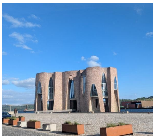
Fjordenhus i smukt solskin.

smukke solskinsvejr ved Fjordenhus-omvisningen var ledsaget af en stiv kuling, men de flotte omgivelser fejlede ingenting, og vores guide delte gavmildt ud af både humor og vid i løbet af rundvisningen.