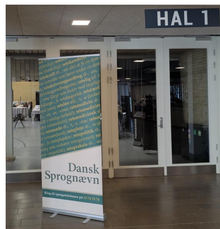
Leksikograferne havde gjort deres indtog i DGI-Huset.

De fem plenarforelæsninger på konferencen var følgende: